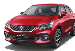
Rojo Metálico Perlado