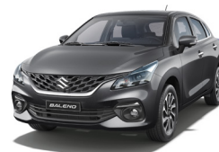
Gris Metálico Perlado