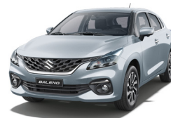
Plata Metálico Perlado