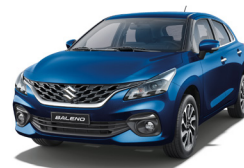
Azul Metálico Perlado